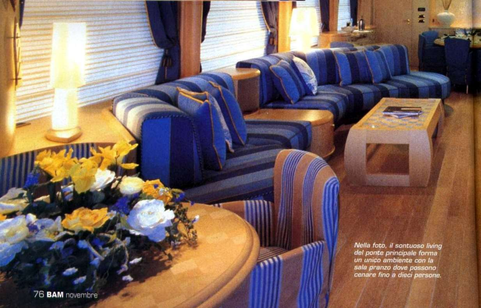
Nella foto, il sontuoso living del ponte principale forma un unico ambiente con la sala pranzo dove possono cenare fino a dieci persone.