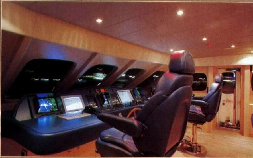
Sopra, la plancia di comando, regno tecnologico della barca e zona regina del ponte superiore. Sotto, la suite armatoriale con pareti decorate da specchi e tessuti.